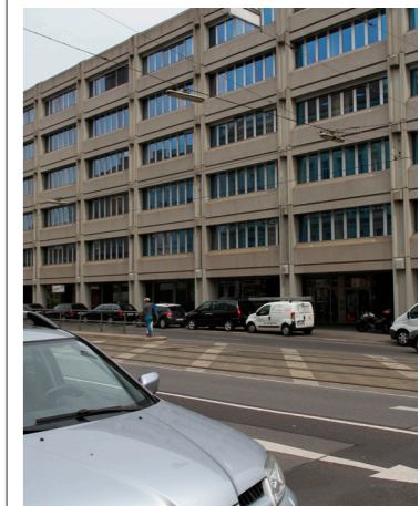
Das ehemalige Finanzamt könnte in ein Hotel umgewandelt werden.

■ Nach dem Umzug des Finanzamts ist die künftige Nutzung des Gebäudes am Ende der Nussdorfer Straße noch nicht entschieden. Laut dem Sprecher der Bundesimmobilien-gesellschaft BIG, Ernst Eichinger, stehen sowohl Büros als auch ein Hotel zur Debatte. Die Geschäftslokale stehen leer.