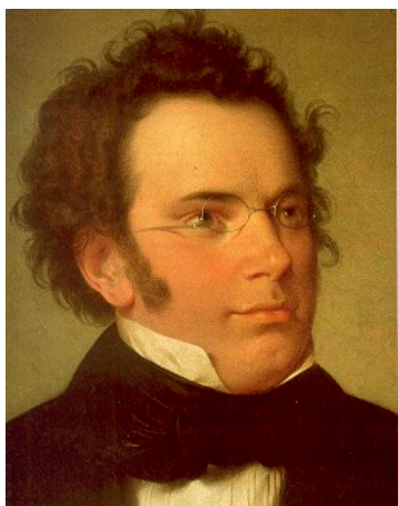
Der Ausnahmekomponist Schubert war als Kind auch Sängerknabe.